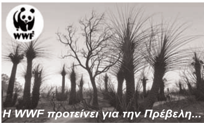
Η WWF προτείνει για την Πρέβελη...